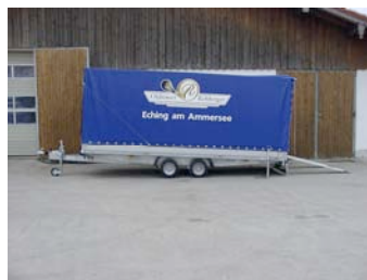
Seitenansicht mit ausgefahrenen Kufen

Selten zu bekommen, bei uns aber gleich zweifach zu mieten: der geschlossene Hänger, mit dem sich längere Anreisen zu Ausfahrten auch mit Vorkriegs-Schnauferln unabhängig vom Wetter bequem bewältigen lassen. Das Beladen ist durch die Seilwinde unkompliziert. Selbst fahrunfähige Schnauferl können so von einer Person aufgeladen werden. Zwei Paar Spanngurte sorgen für die Fixierung während des Transports.