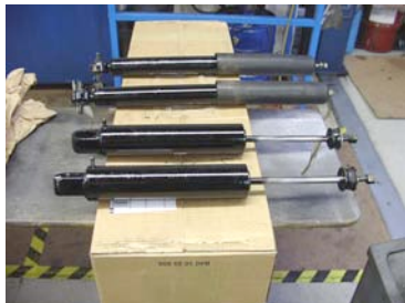
Reparierte und neu befüllte Originalstoßdämpfer

Wenn Sie die Lösung für ein technisches Problem Ihres Oldtimers suchen, sprechen Sie uns an. Entweder haben wir sie bereits oder wir entwickeln sie individuell für Sie.