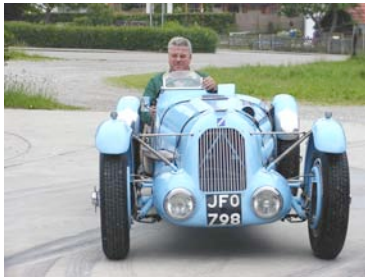
Talbot Darracq Rennwagen aus den 30er Jahren