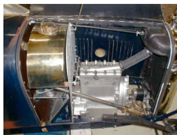
Neu angefertigter Tank aus Messing

Viele Antriebe, egal ob im Getriebe, dem Differential oder zum Beispiel dem Magneto Ihres Wagens funktionieren mittels Zahnrädern. Sind diese verschlissen, ist die Beschaffung schon deshalb kompliziert, weil die Originalmaße nicht mehr zu ermitteln sind. Wir fertigen sie deshalb jetzt nach, egal ob gerade-, schräg- oder spiralverzahnt.