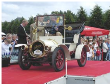
Cottereau Populaire von 1903

Der Cottereau Populaire von 1903 erhielt auf dem Concours d'Elegance des AvD in Schwetzingen 2007 den zweiten Preis in der Klasse unrestaurierter Vorkriegsfahrzeuge.