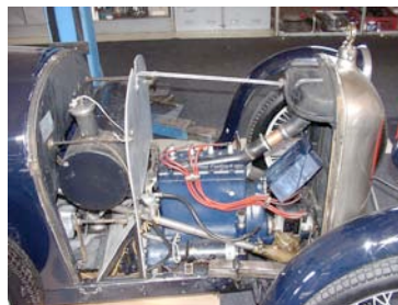
Links der ursprünglich im Fahrzeug eingebaute Standard-Tank

Maßfertigung eines Tanks für einen Amilcar CS, der zur Volumenverdoppelung des mitgeführten Treibstoffs führt.