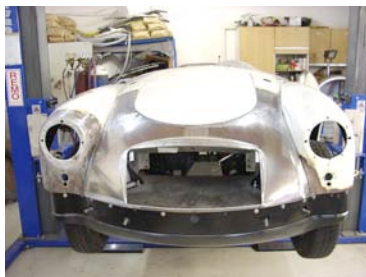
Instand gesetzte Karosserie vor der Lackierung

Weiterhin sind wir während der Saison auch außerhalb der Geschäftsöffnungszeiten und am Wochenende gerne für Sie da, wenn Ihr Oldtimer Hilfe braucht. Und dies ohne Sonn-, Nacht- und Feiertagszuschläge.